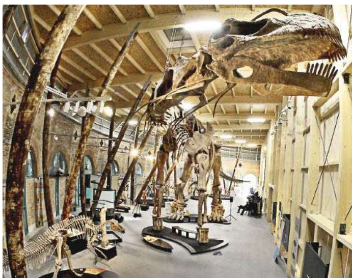
El Argentinosaurus huinculense es exhibido en el centro de exposiciones de Rosenheim (Alemania) La muestra se titula "Dinosaurios-Gigantes de la Argentina"

Estos materiales fueron comunicados en las VI Jornadas Argentinas de Paleontología de Vertebrados, y están depositadas dentro de la Colección de Paleontología de Vertebrados en el Museo Municipal de Carmen Funes de Plaza Huinul, Provincia del Neuquén, con las siglas PVPH-1.