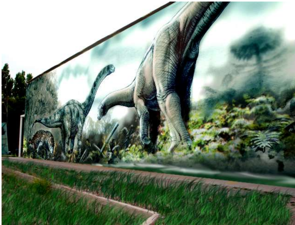
Murales en las actuales instalaciones del predio