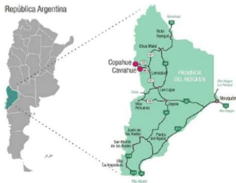
MAPA DEL CRUCE POR EL PASO COPAHUE, NEUQUÉN, ARGENTINA.

Por último, es importante destacar que el documental se verá en todo el país, y al pertenecer a Contenidos Públicos S.E., estará disponible y se repetirá en todas las redes de televisión digital, y canales de aire estatales.